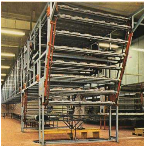
冷却输送机。 Cooling conveyor.

可能的应用实例 / Examples of possible applications: